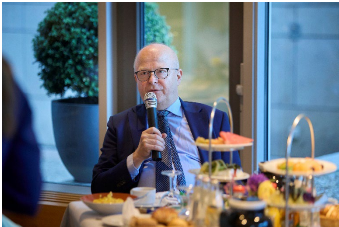
Michael Theurer (parl. Staatssekretär für Digitales und Verkehr) dankt den Vortragenden und diskutiert über verschiedene CDR-Verfahren.