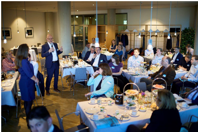
Parlamentarisches Frühstück „Klimaneutralität 2045 – Chancen und Herausforderungen von DACCS und BECCS“ am 17. Mai 2024 im Deutschen Bundestag.